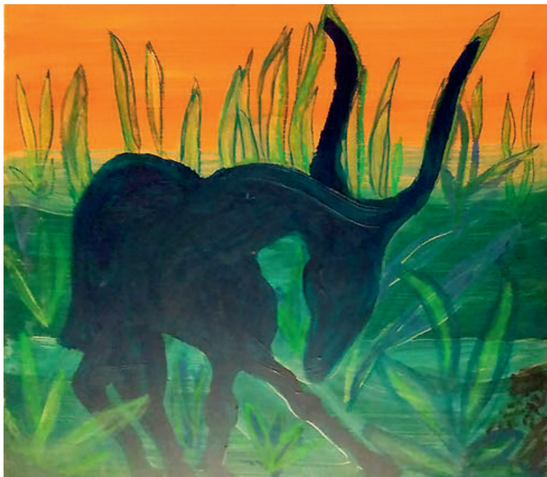
Illustration av LO