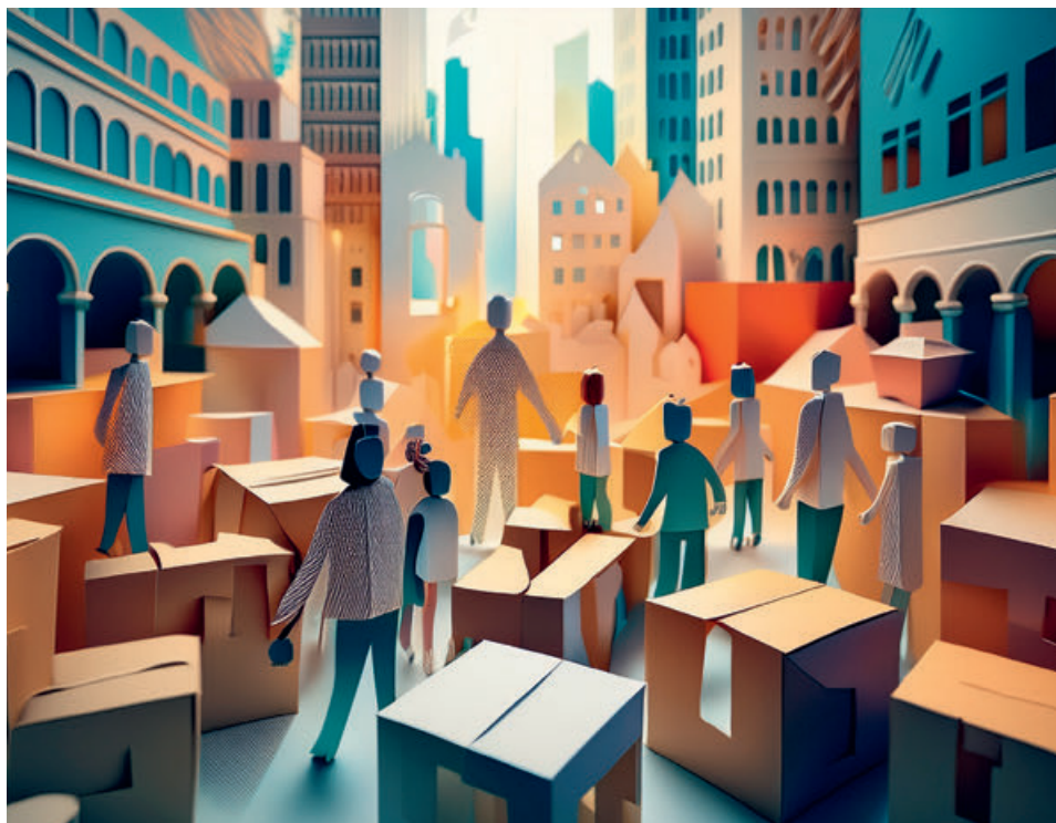
Många flyttade till Stockholm fram till 2014. Sedan vände det och fler lämnade staden.