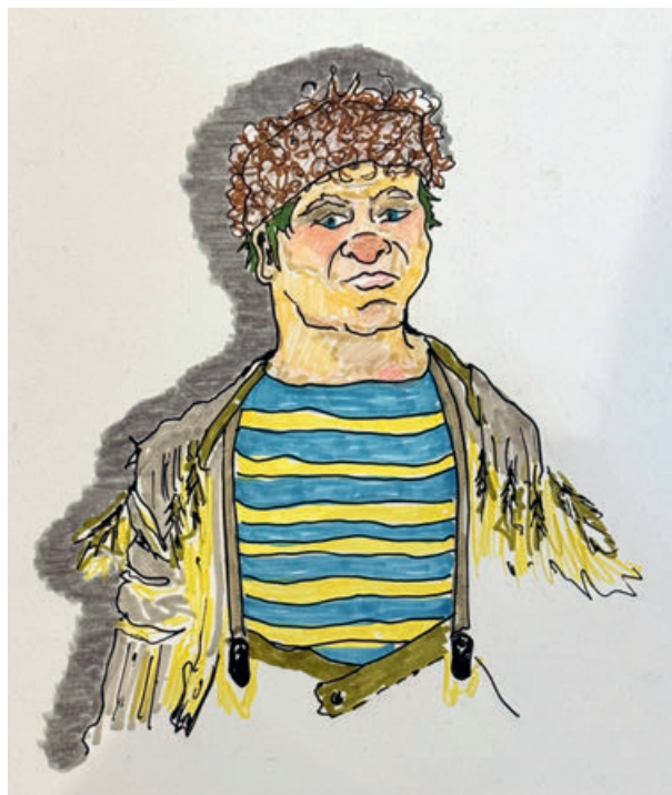
Illustration av V.S.